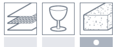
Composite Glas und Keramik Stein