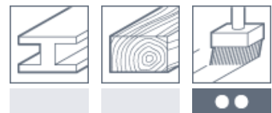
Metall Holz Lack